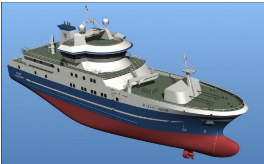
GEIR II – Autolinefartøy med dragebrønn